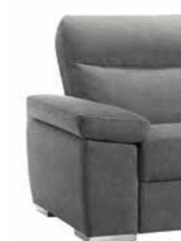
PIEDE OPTIONAL ART. CA560 H. 4 cm metallo cromo lucido