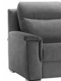
PIEDE OPTIONAL ART. P503NEP503 H. 3 cm wengé e cromo