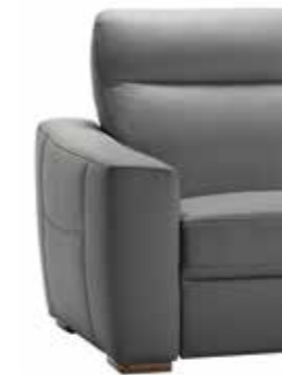
PIEDE OPTIONAL ART. CA 137 H. 3,5 cm legno noce