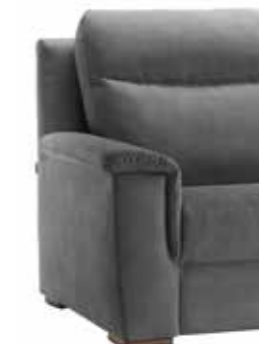
PIEDE OPTIONAL ART. CA 137 H. 3,5 cm legno noce