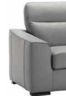
PIEDE OPTIONAL ART. OSLREG H. 4 cm legno wengé