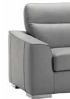
PIEDE OPTIONAL ART. CA 560 H. 4 cm cromo lucido